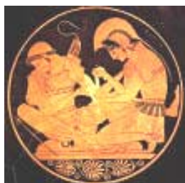
Los griegos colonizan el Mediterráneo y viven del producto de sus colonos.

Desde -2100 es la era ARIES o Cultura de Monolatría y Conquistas Griegas y Asirias. Mesías: Abraham