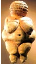
Venus Willend. Matriarcado ERA CÁNCER -8400 a -6300