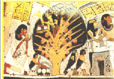
La Diosa Madre se hace presente también en Egipto y Mesopotamia. En el centro figura el árbol de la vida. La vida femenina es el modelo y se hace sedentaria.