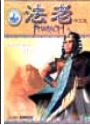
Faraón, el amo Monopolio ERA TAURO -4200 a -2100