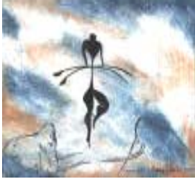
Fin Hielo, luchas solares Monarquía ERA LEO -10.500 a -8400

Las últimas seis eras cubren 12.600 años: