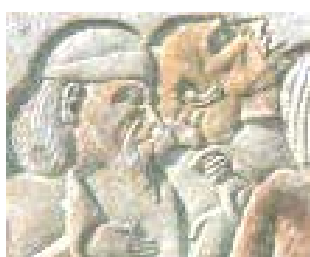
Los asirios asolan todo el mundo antiguo, conquistando para vivir y no trabajar