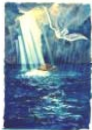
El calor derrite los hielos causando diluvios que eleva el nivel de mares

Desde -8400 es la era CANCER o Cultura de los Matriarcados y los Palafitos. Idolo: la diosa Madre