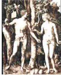
Adán y Eva Monogamia ERA GÉMINIS -6300 a -4200