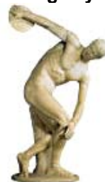
El Discóbolo de Mirón es símbolo de la fuerza de esta era.