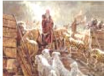
Nacen numerosas leyendas sobre los diluvios, la más conocida de todas es la de El Arca de Noé, que porta un par de cada especie.