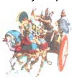
El uso del carro de combate y la vida nómada.