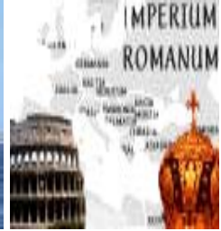
Imperio Romano Monoteísmo ERA PISCIS 0 a 2100

Veamos ahora era por era desde el año -8400.