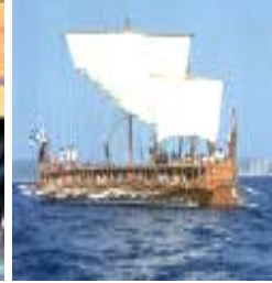
Griegos colonizan Mar Monolatría ERA ARIES -2100 a 0