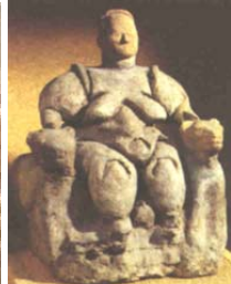
La Humanidad es un matriarcado debido a la falta de mujeres. Se les dedica varias estatuillas llamadas Venus o Diosa Madre. Ella es la mesías hembra de la era Cáncer.