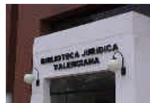
Frontal de la entrada a BIJUVA