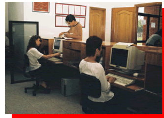
Zona de Referencia, Prestamo y atención a los usuarios.