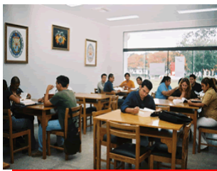
Zona de la Sala de Lectura de BIJUVA