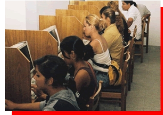
Zona de Consultas informatizadas y acceso a Internet.