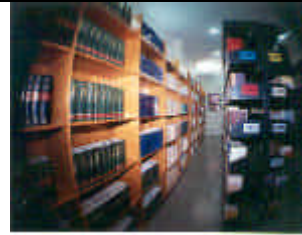
Interior de la zona de Depósito de BIJUVA

Su vocación a medio-largo plazo es convertirse en un centro de referencia bibliográfico que pueda ser aprovechado por las universidades y profesionales del entorno, tanto bolivianos como de otros países de América Latina.