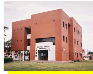
Edificio de postgrado de la Facultad de Ciencias Jurídicas, Políticas y Sociales donde se encuentra ubicada la BIJUVA Santa Cruz de la Sierra (Bolivia)

A los cerca 14.000 volúmenes actuales, procedentes de la donación canalizada a través de la Universitat de Valencia, se sumarán próximamente varios miles más procedentes