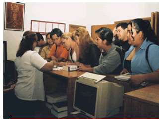
Formación de Usuarios